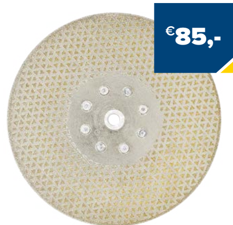
Art. Nummer CGNC230M00 CARAT NATUURSTEEN / COMPOSIT 230XM14, CGN CLASSIC