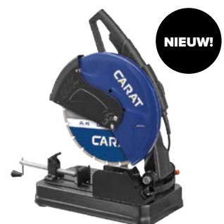
EasyCoup Compact 350