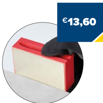
Art. Nummer EHP2000000 KORREL 200