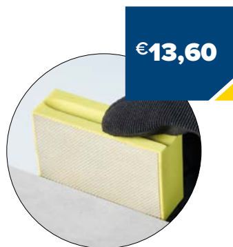
Art. Nummer EHP4000000 KORREL 400