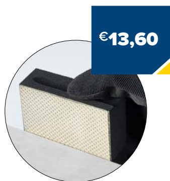
Art. Nummer EHP1200000 KORREL 120