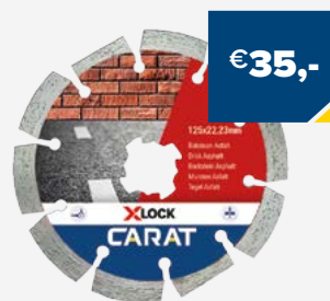
Art. Nummer CAXLOCK125 CARAT BAKSTEEN 125X22,23