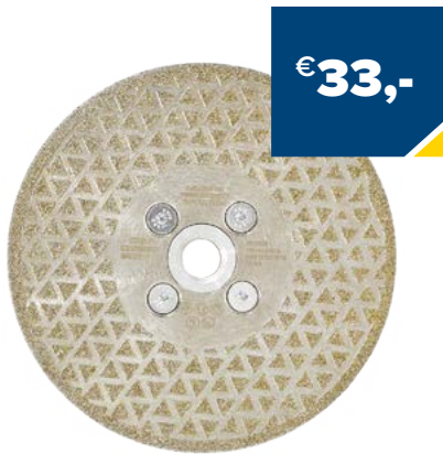
Art. Nummer CGNC125M00 CARAT NATUURSTEEN / COMPOSIT 125XM14, CGN CLASSIC