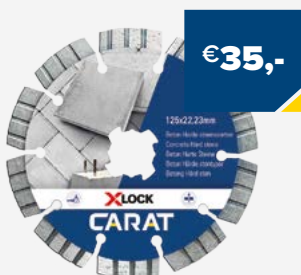
Art. Nummer CCXLOCK125 CARAT BETON 125X22,23

HET WISSELEN VAN DIAMANTZAAGBLADEN WAS NOG NOOIT ZO GEMAKKELIJK