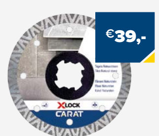
Art. Nummer CTXLOCK125 CARAT TEGELS 125X22,23