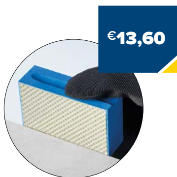
Art. Nummer EHP0600000 KORREL 60