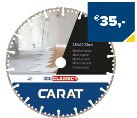
Art. Nummer CGUC230300 CARAT MULTIFUNCTIONEEL 230X22,23, CGU CLASSIC