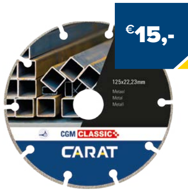
Art. Nummer CGMC125300 CARAT METAL 125X22,23 CGM CLASSIC

Meer informatie over onze speciale toepassingen