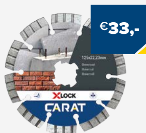
Art. Nummer CUXLOCK125 CARAT UNIVERSEEL 125X22,23