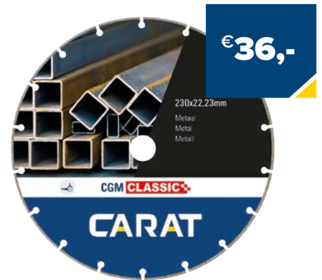
Art. Nummer CGMC230300 CARAT METAL 230X22,23 CGM CLASSIC