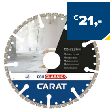
Art. Nummer CGUC125300 CARAT MULTIFUNCTIONEEL 125X22,23, CGU CLASSIC

Meer informatie over onze speciale toepassingen